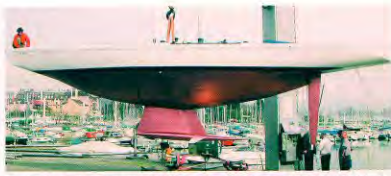
Nieuwe vleugelkiel en roer voor YQUEM, een International 8 Meter, die dit jaar de Atlantic Cup won en een tweede plaats veroverde bij de wereldkampioenschappen (ontwerp Piet van Ossanen).

"Zeker, we hebben zelfs al een charterschip, een tjalk die een paar keer per jaar een wedstrijd vaart en beter wil presteren, onder handen genomen. Het schip heeft inmiddels een nieuw roer en een nieuw zeilplan. Voor het IFKS-skútsje Elisabeth hebben we een grote studie uitgevoerd. Het IFKS reglement is heel interessant. Je mag verschillende zeiloppervlakken hebben, behorende bij verschillende scheepslengten. Voor dit soort specifieke sche-